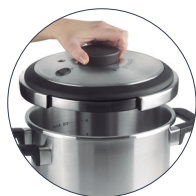
Sistema de apertura y cierre con una sola mano