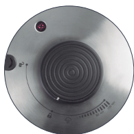
Nivel de cocción totalmente ajustable: entre 0 y 100 kpa