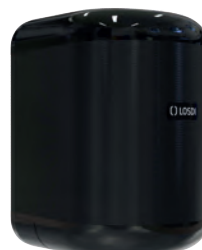
REF: CP-3010-BL Acabado NEGRO