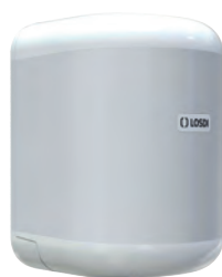
REF: CP-3010-B Acabado BLANCO