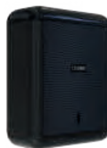
REF: CP-3009-BL Acabado NEGRO