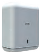
REF: CP-3009-B Acabado BLANCO