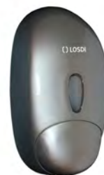
REF: CJ-1003-CG Acabado PLATA