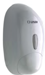
REF: CJ-1003 Acabado BLANCO