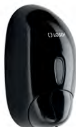
REF: CJ-1003-C-BL Acabado NEGRO