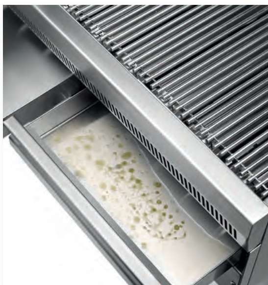
Bandejas contenedoras de agua Water container trays