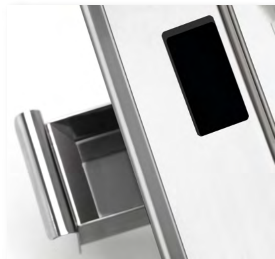
Cajón recolector Collection box