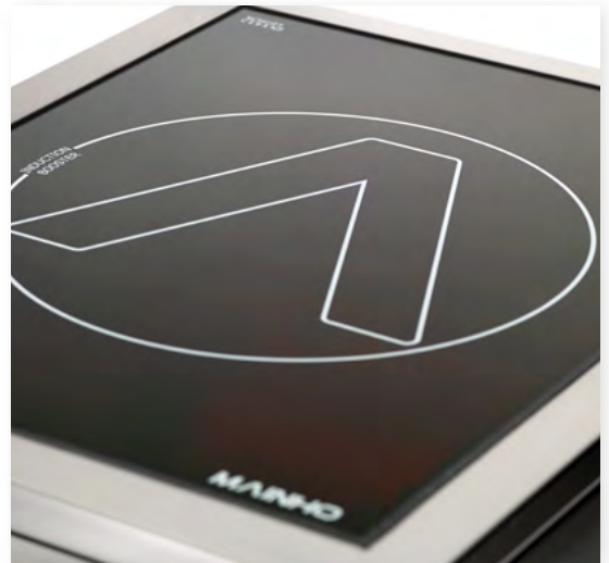
Detalle del cristal Detail of glass