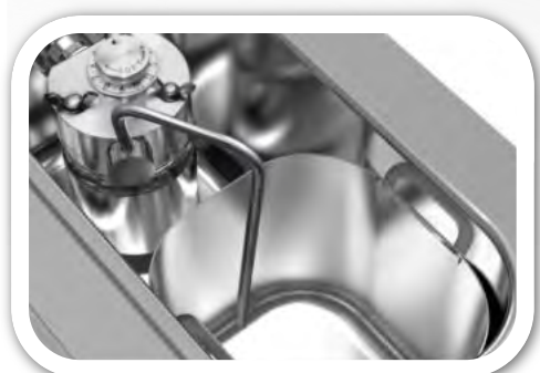
Bomba y depósito extraíble con sistema anti-hielo