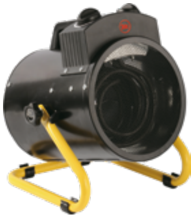
EH CANNON BGP 03