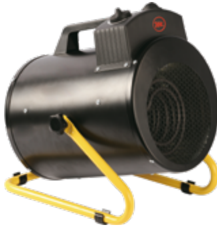
EH CANNON BGP 05