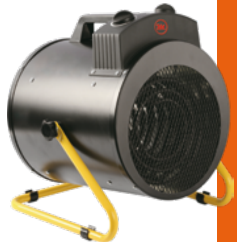
EH CANNON BGP 09