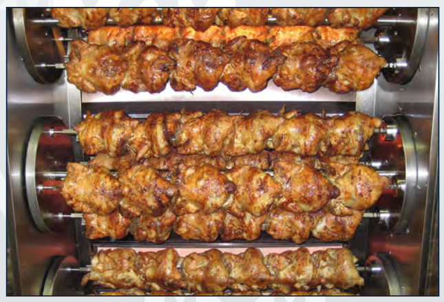
detalle 12 MR

Diámetro ruedas: 12 cm Diameter of wheels: 12 cm