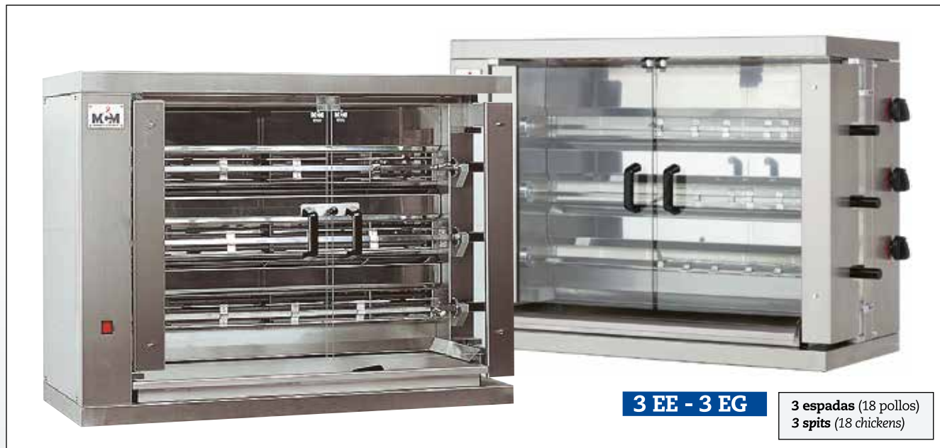
3 EE - 3 EG

3 espadas (18 pollos) 3 spits (18 chickens)