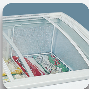
Tapas curvas deslizantes.