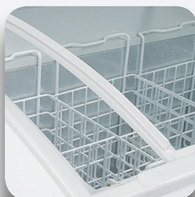
Equipado de serie con cestas.