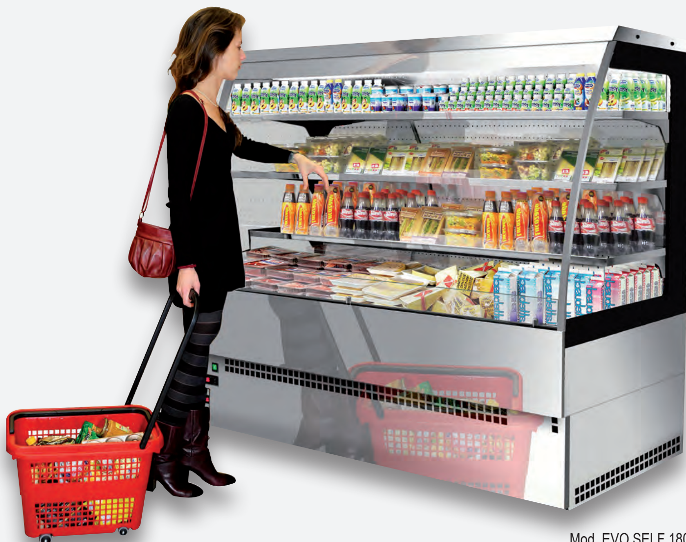
Mod. EVO SELF 180