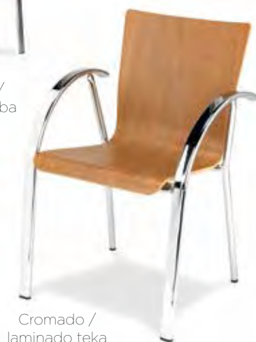
Cromado / laminado teka