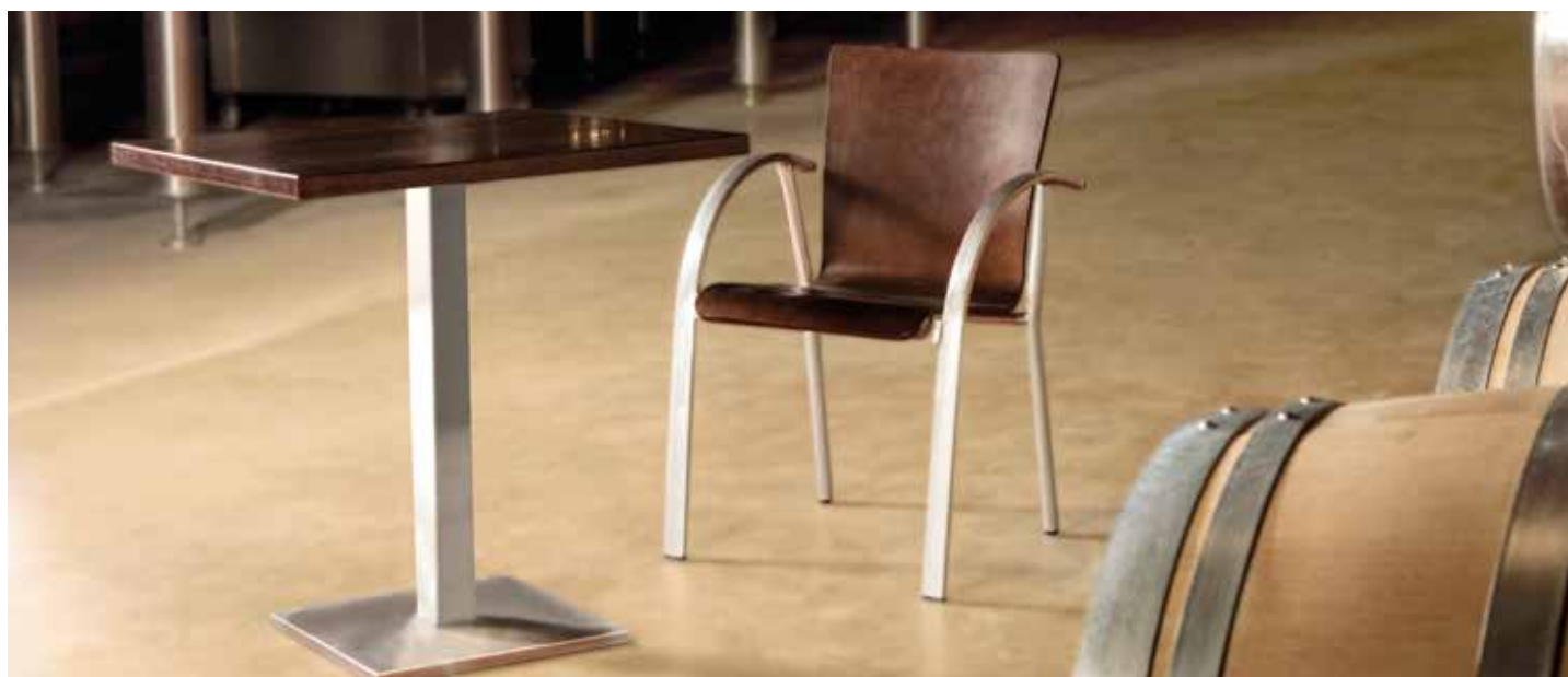
Sillón M246 aluminio carcasa madera Nogal. Mesa M323 columna Nogal, tablero chapado haya canto haya 70x70 cm Nogal.