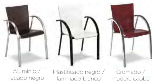
Aluminio / lacado negro