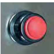
Chispero / Lighter