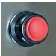
Chispero / Lighter