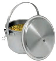
Tirador en acero AISI 304