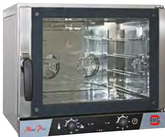
Mod. Maxi-Plus PL