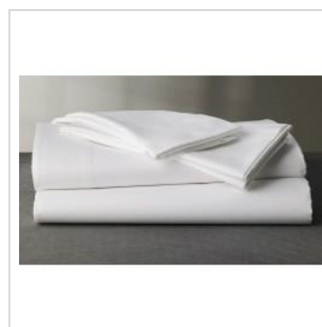
BAJERA AJUSTABLE ...