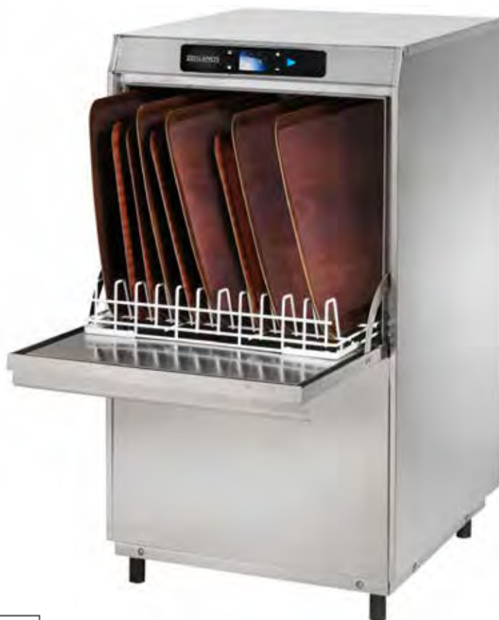
Mod. N-800 EVO