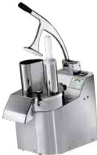
TV 2000R 2303V