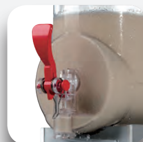
Maneta salida producto.