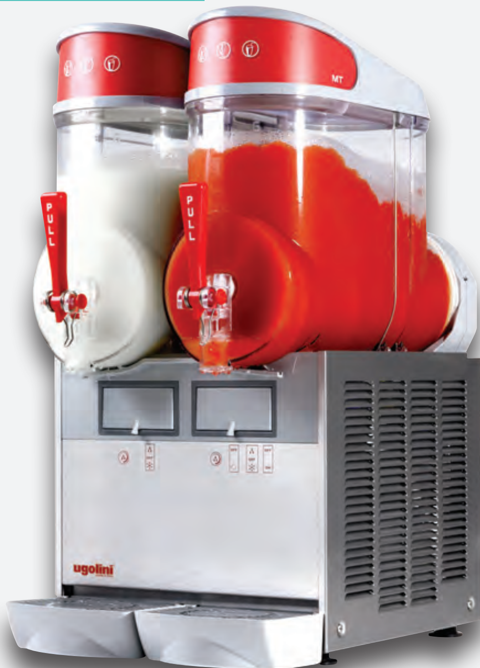
Mod. MT 2B