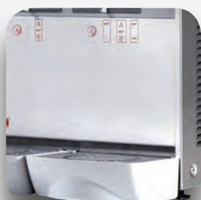
Recoge gotas extraíble.