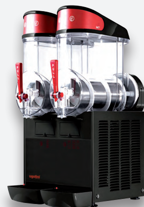
Mod. MT 2B NEGRA