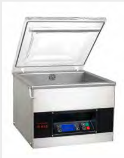
Mod. S-215 PX