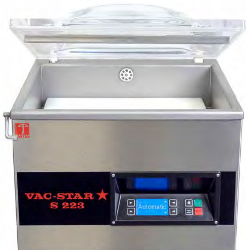
Mod. S-223 PX