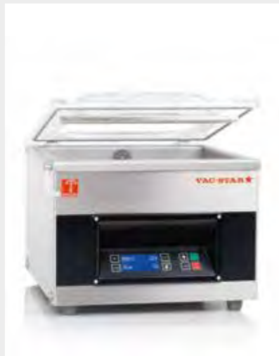
Mod. S-210 PX