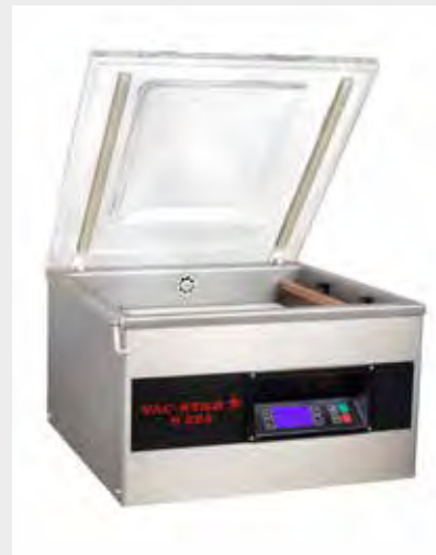
Mod. S-225 PX