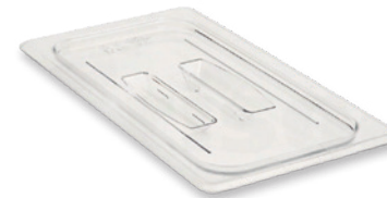
TAPA CUBETA POLICARBONATO INCLUIDA