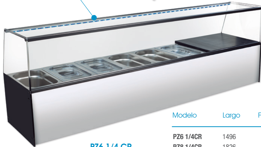
PZ6 1/4 CR