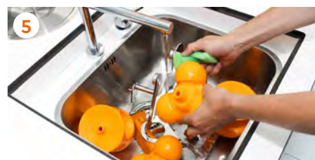
5 Limpiamos todas las piezas con una esponja y jabón, aclaramos después con agua limpia. También pueden lavarse todas las piezas en el lavavajillas .