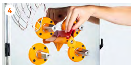
4 ¡Atención! Extraiga el protector de cuchilla antes de montar el kit.