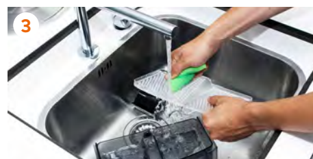
3 Limpiamos pieza a pieza a mano o en el lavavajillas. Lea recomendaciones sobre piezas en el lavavajillas (Pág. 2)