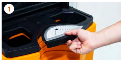
1 Insertamos la bandeja anti goteo y su filtro .