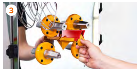
3 Insertamos la cuchilla presionando hacia el fondo hasta notar el clip.