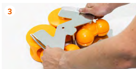
3 Levantamos las asas de acero inoxidable.