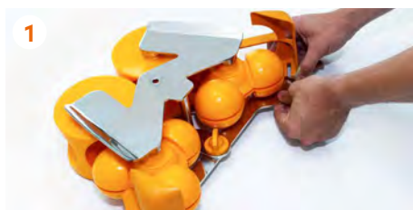
1 Retiramos las cuñas extractoras situadas en los extremos laterales inferiores.

Para una limpieza en profundidad , procedemos a desmontar el Kit de Extracción 1Step y limpiar todas las piezas.