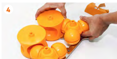
4 Retiramos los tambores de exprimido .