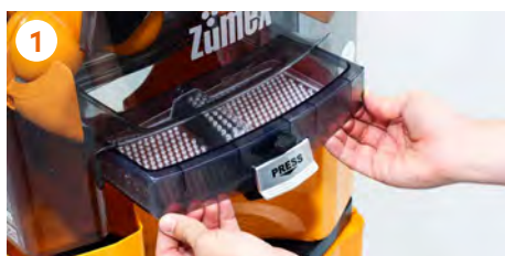
1 Desmonte cubeta de zumo y cubierta .

Cubierta, Kit de Extracción 1Step, cubeta, filtro y grifo