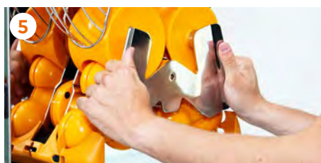
5 Insertamos el conjunto del kit de extracción en los ejes de sujeción.