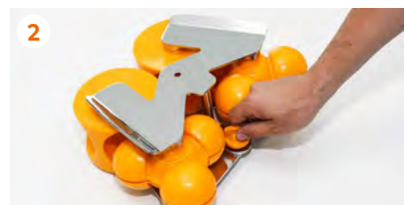
2 Desenroscamos el pomo situado en la parte inferior central.