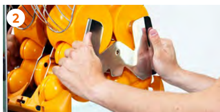
2 Extraemos el Kit de Extracción 1Step y la cuchilla .