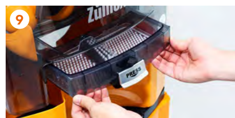
9 Montamos la cubeta de zumo con el filtro .