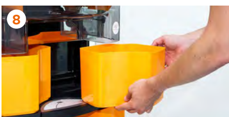
8 Colocamos las cubetas empujando hasta llevarlas a su posición.