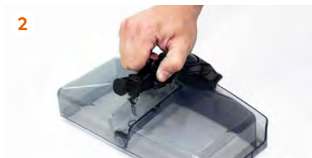
2 Montamos el grifo presionando con cuidado las dos patillas.