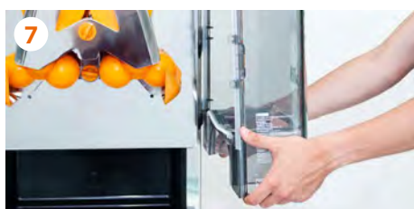
7 Montamos la cubierta delantera .