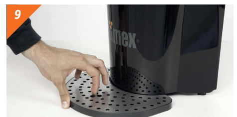
Desmontamos la bandeja posavasos introduciendo nuestro dedo índice por uno de los agujeros centrales de la pieza de acero y tirando hacia arriba.