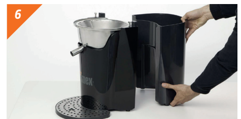
Desmontamos el cubo de residuos tirando horizontalmente hacia fuera.