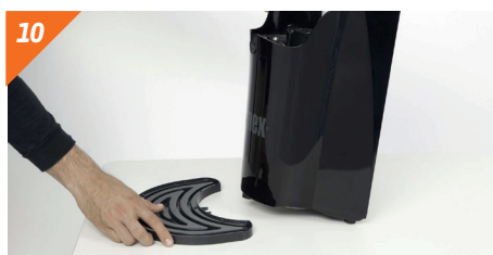
Tirarnos ligeramente de la bandeja posavasos hacia fuera.