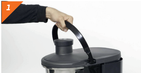
Levantamos el asa de seguridad.

Zumex recomienda limpiar la máquina al menos 1 o 2 veces al día , dependiendo de su uso, para mantener las condiciones de higiene alimentarias.