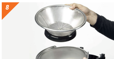
Separamos el filtro de la cubeta. ¡ATENCIÓN! No toque la puntas afiladas del rallador, ya que podría cortarse.